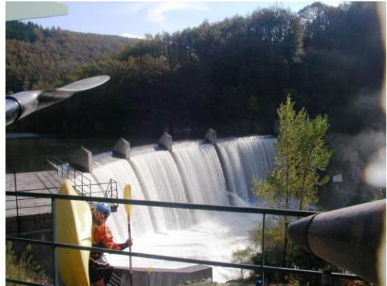
Barrage de Pontviel (départ)