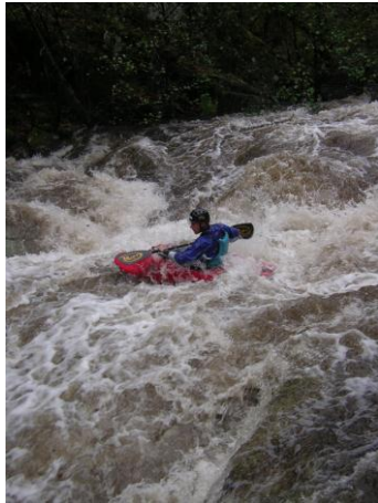
Escalier de la Peyre